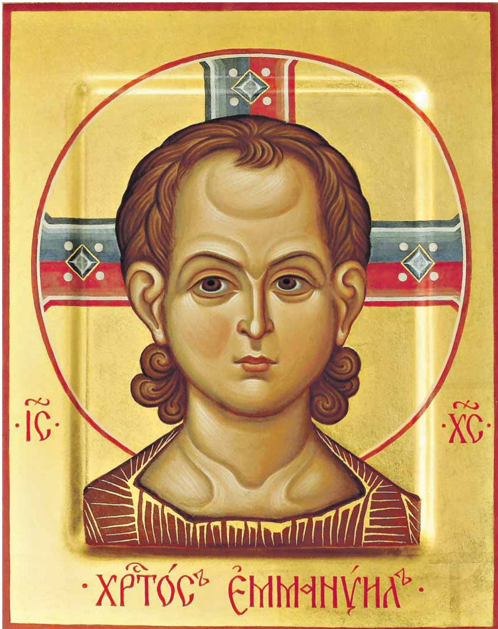
Kristus Immanuel. Venäläinen ikoni, 2000-luku.