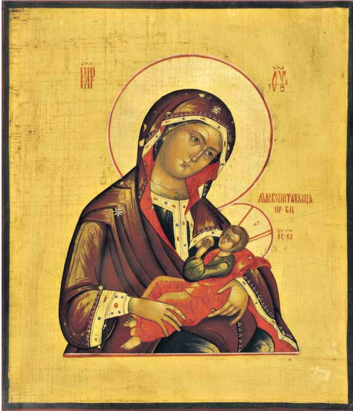
Imettävä Jumalanäiti.

"Sana tuli lihaksi ja asui meidän keskellämme" (Joh. 1:14).