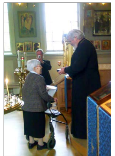
Monia armorikkaita vuosia!