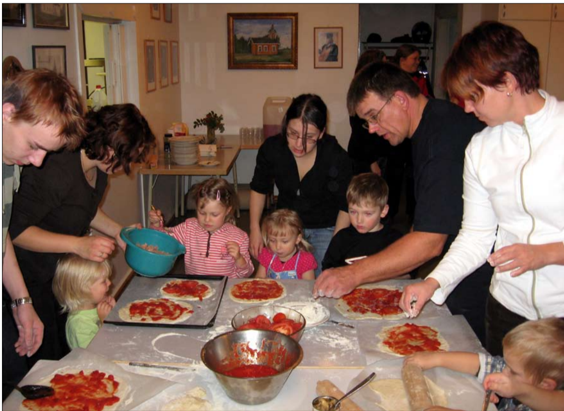
Pitsanpaistajaiset kokosivat seurakuntasalille kaikenikäisiä.