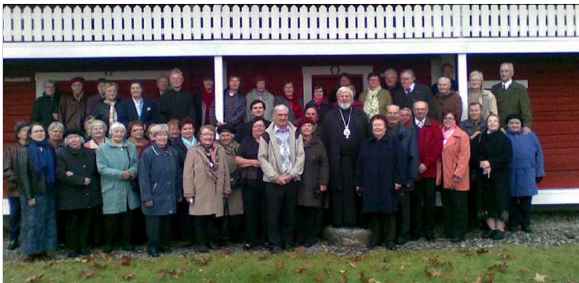
Rautalammin ortodoksisen seurakunnan retkeläiset pääsivät yhteiskuvaan arkkipiispa Leon kanssa hänen kotilallaan 14. lokakuuta 2008. Lue matkakertomus viereiseltä sivulta.