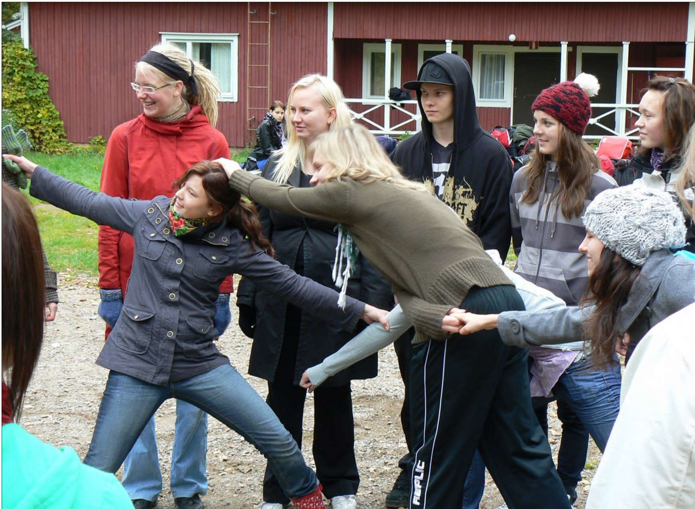
Jatkokristinoppileiriläiset vauhdissa Pyhäkankaalla 12.-14.9.2008.