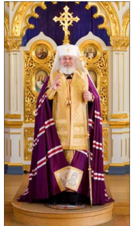
Suuri paasto alkaa laskiaissunnuntaista 14.2. Paaston liturginen väri on violetti.