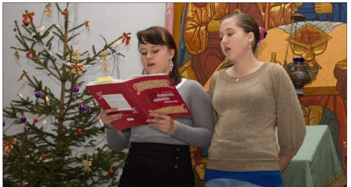
Mariat lauloivat ortodoksisia joululauluja Nikolaos-juhlassa.