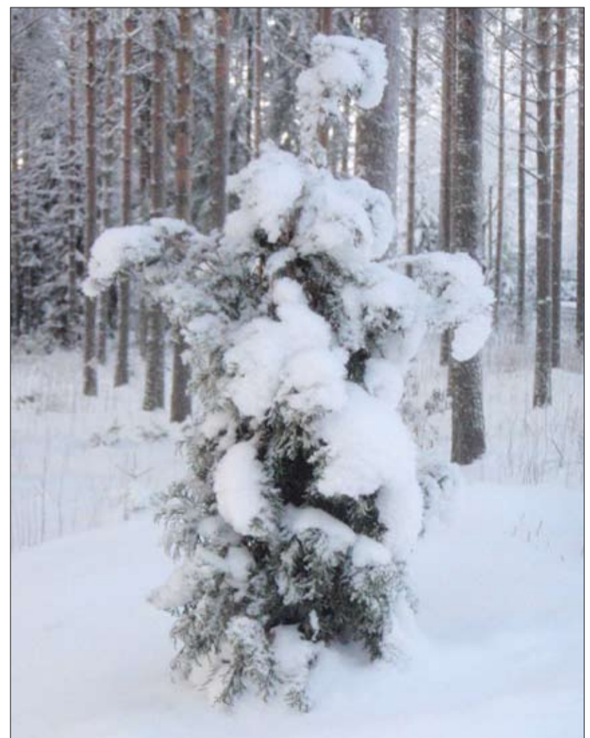
Tänä talvena luonto on muovannut monia taideteoksia. Kuvassa luonnollinen risti.