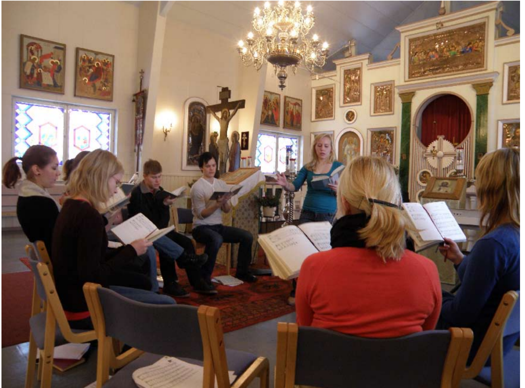
ISON on nuorten kirkkomuusikoksi opiskelevien organisoima projekti, joka kokoaa nuoria yhteen harjoittelemaan kirkkomme musiikkia ja perinnettä. Kuvan ISON oli Jyväskylässä, seuraavaksi ISON kokoaa väkeä Mikkelissä.

Kirkkokuorojen rivit harvenevat jatkuvasti ja olisi tärkeää, että saisimme nuoria mukaan toimintaamme. Me nuoret olemme kuitenkin kirkkomme tulevaisuus ja meidän vastuullemme jää, että kirkko elää ja hengittää myös tulevaisuudessa.