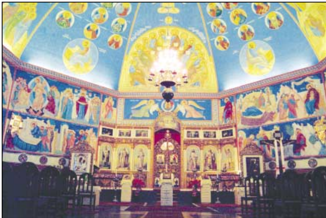
Profeetta Elian kirkko kutsuu muun muassa uusia laulajia.