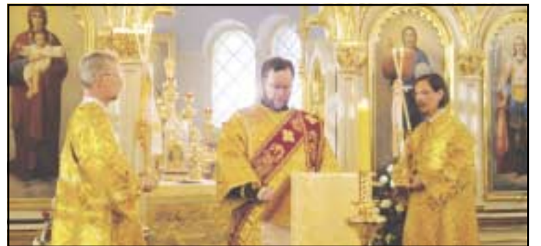
Ipodiakonit avustavat piispan toimittamissa jumalanpalveluksissa.