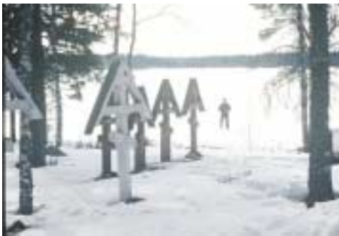
Pääsiäistä voi viettää myös ortoksihenkisesti suksilla

Perinteinen Vienan hiihto järjestetään 27.3. 2005 18. kerran Suomen vienankarjalaisten kylien Kuivajärven ja Hietajärven sekä erämaisen Murhisalon luonnon-suojelun alueen maisemissa.