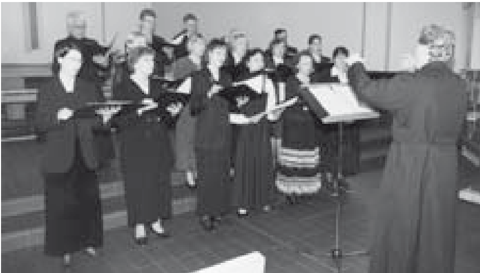
Lahden kuoro esiintyy ristin-kirkossa v. 2001