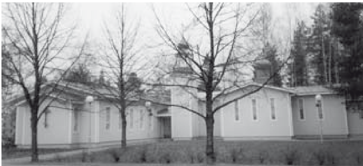
Hyvinkään vastavalmistunut kirkko

Riihimäellä on jumalanpalveluksia toimitettu ev.lut. seurakunnan hautausmaan kappelissa, mutta riihimäkeläisillä on toiveena saada oma jumalanpalvelustila kaupunkiin. Siinä on tulevaisuuden haastetta Riihimäen ortodoksiapiirille.