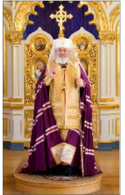
Suuri paasto päättyy 11.4. Paaston liturginen väri on violetti.

Risti-isä tai –äiti kasvaa yhdessä kummilapsensa kanssa. Yhteisön jäsenenä he kaikki ovat jakamassa samaa