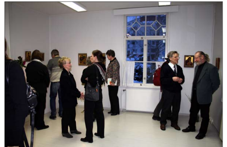
Varkauden ikonipajan väki järjesti näyttelyn taidekeskus Väinölässä Varkaudessa.