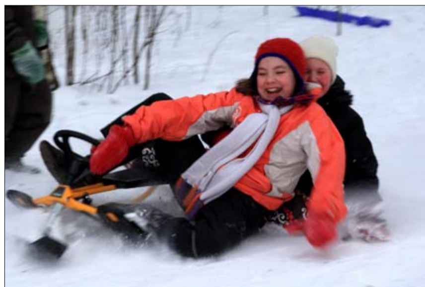
Sovintosunnuntaina Jyväskylässä laskettiin mäkeä sekä syötiin vohveleita.