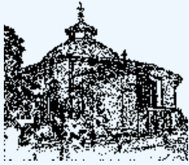
MIKKELIN ORTODOKSINEN SEURAKUNTA